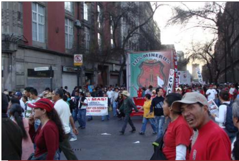
Los trabajadores mineros han sido blanco de ataque permanente a sus derechos.