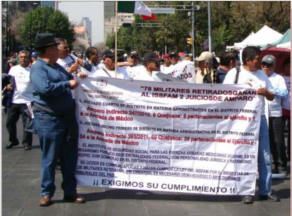
Hasta los militares retirados salieron a protestar contra el despojo de su derecho a la seguridad social.