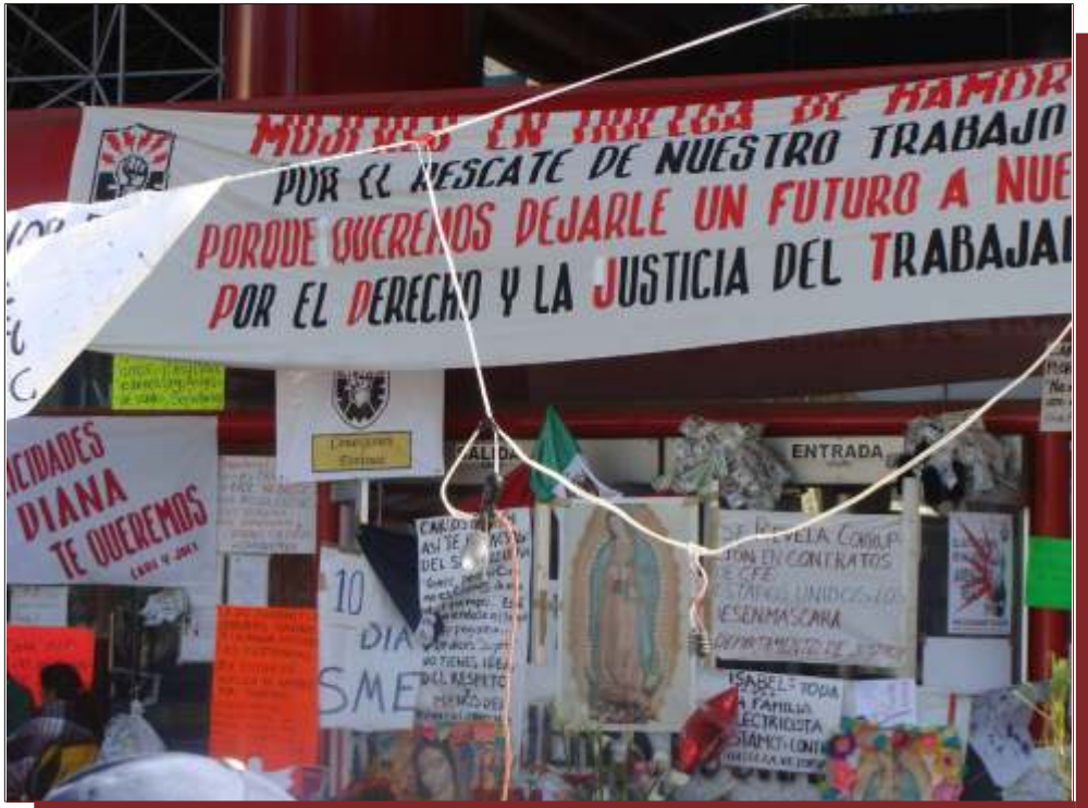
Las mujeres electricistas fueron las primeras en realizar una huelga de hambre el 23 de noviembre del 2009, para exigir que se echara abajo el decreto ilegal de extinción de Luz y Fuerza del Centro.