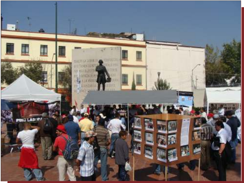
El equipo de Frecuencia Laboral instaló en la plaza “Zarco” (prócer de la libertad de expresión) una exposición pública, sobre las luchas laborales que ha difundido en sus noticiarios.