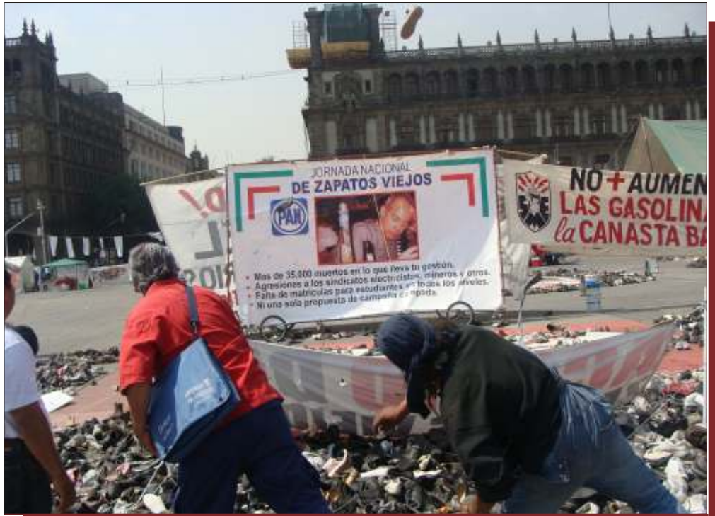
El zapatazo contra el ex presidente Felipe Calderón fue todo un éxito. Transeúntes que pasaban por el Zócalo de la Ciudad de México, aprovechaban para lanzarle, durante varios minutos, unos chanclazos.