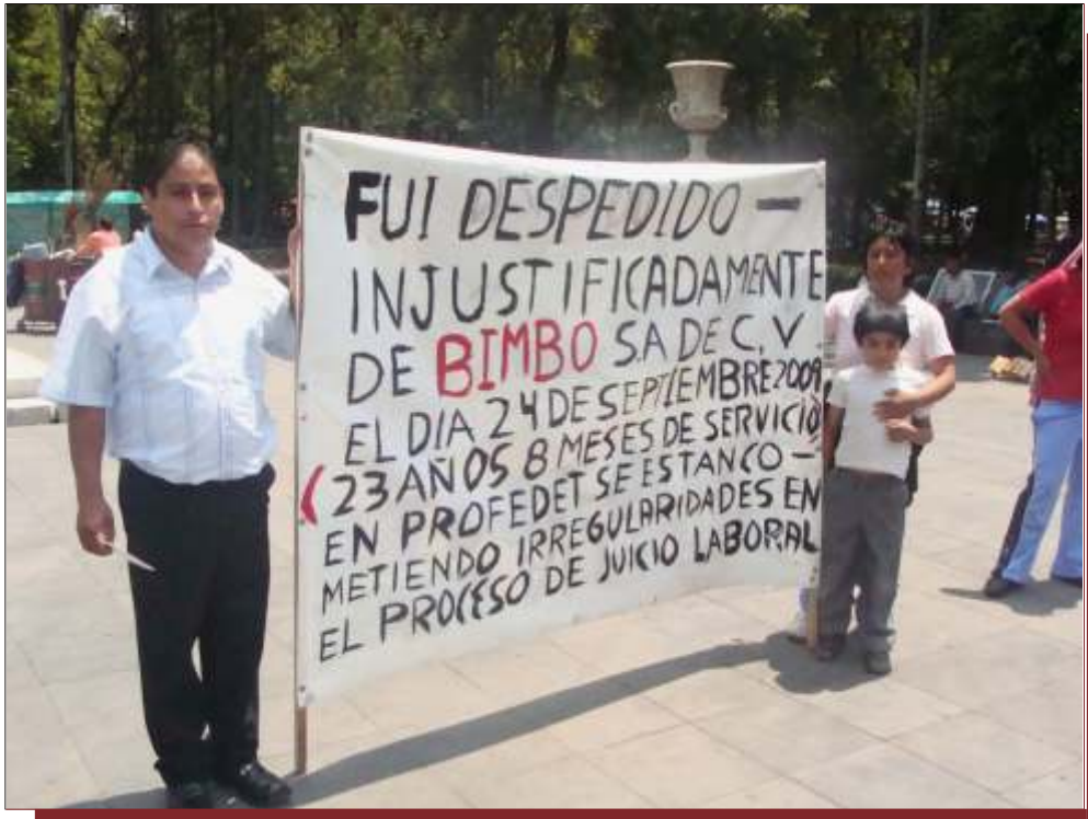
El despido injustificado de trabajadores, que están por cumplir los años que marca la ley para tener derecho a una pensión y/o jubilación, se hizo común en el nuevo siglo.