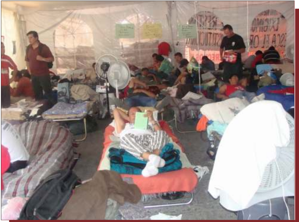
La segunda huelga de hambre del Sindicato Mexicano de Electricistas que inició el 25 de abril del 2010, se prolongó por 3 meses.